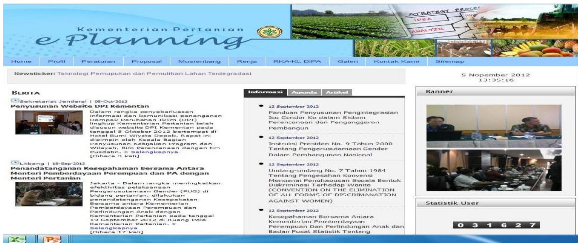
Gambar 4.1. Situs web www.pertanian.go.id/eplanning

Aplikasi e-Proposal dapat diakses pada laman www.pertanian.go.id/eplanning dan data proposal akan disimpan pada server Kementan. Untuk mengisi formulir proposal secara elektronik dibutuhkan sistem sebagai berikut: koneksi ke internet, perangkat lunak ( software ) browser (internet explorer 7+, mozilla firefox 2+, Opera 9+, dan Safari 2+) dengan mengakses ke situs web: dengan contoh disajikan pada Gambar 4.1.